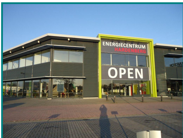
Interne verbouw 3200m 2 Energiecentrum Hardenberg Opdrachtgever: DGB Energie

Indien ook u aanvullende informatie wenst over dit onderwerp, kunt u contact opnemen met Eddy Speelman. Hij is te bereiken via telefoonnummer 06-51075033.