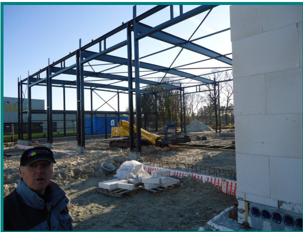
Brandweerkazerne Roden Opdrachtgever: Gemeente Noordenveld

Eind vorig jaar hebben we uit aanbesteding een prachtig werk gescoord. Namelijk de nieuwbouw van de Brandweerkazerne voor de gemeente Noordenveld. Inmiddels is het werk in volle gang en lopen we ondanks het winterweer van de afgelopen maanden op planning. Gezien onze kantoor bezetting en het zo minimaal mogelijk willen houden van de kosten, hebben we voor dit werk een werkvoorbereider+ van onze partner uit Hardenberg ingeleend.