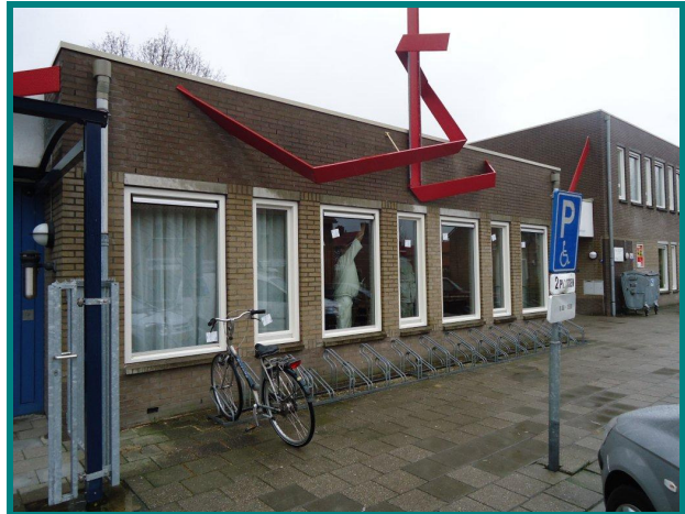
Vervangen 67 kozijnen t' Knooppunt Hoogeveen Opdrachtgever: Gemeente Hoogeveen