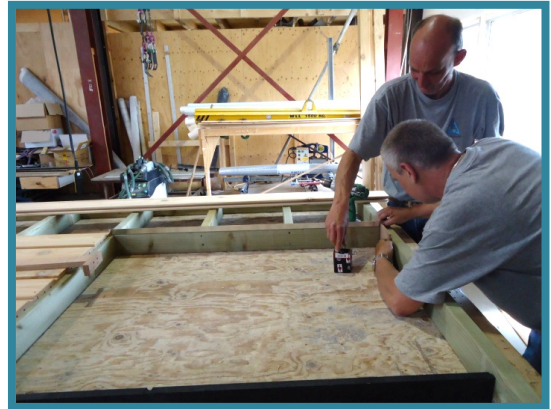
Aan het werk in de timmerfabriek van Alreno Bouw

Een dergelijke samenwerking is natuurlijk prachtig voor Alreno Bouw, door het inbrengen van kennis en kunde vanuit een regulier bouwbedrijf kunnen we ons steentje bijdragen aan het realiseren van grote projecten. En zodoende krijgen wij ook meer continuïteit in onze werkvoorraad.