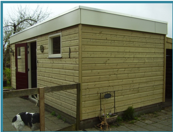
Berging in Kleindijk Opdrachtgever: Woonservice Westerbork

Ook bouwkundig worden er jaarlijks nogal wat aan-, ver- en nieuwbouwprojecten gerealiseerd. Veelal in combinatie met onze eigen timmerfabriek waar door 10 medewerkers houtskeletbouw constructies worden geproduceerd. Deze constructies worden op de bouwplaats in een kort tijdsbestek geplaatst.