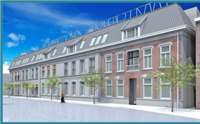
Impressie Spoorzone in Enschede Opdrachtgever: Van Dijk Groep

Over twee weken zal een bijzonder project in samenwerking met de Van Dijk Groep uit Hardenberg starten in onze timmerfabriek in Beilen. Het betreft hier het maken van luchtdichte dakkapellen en dakelementen voor het project Spoorzone wat de Van Dijk Groep in opdracht van Woningcorporatie De Woonplaats uit Enschede gaat bouwen. Het totale project omvat de nieuwbouw van 18 zorgappartementen aan de Molenstraat in Enschede.